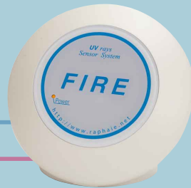
受信機(無線タイプ) SKH086R