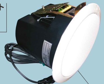
スピーカー内蔵タイプ SKH073