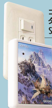
コンセント タイプ SKH049