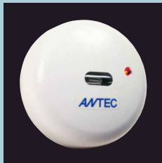
標準 タイプ SKH047