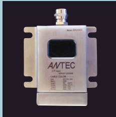
重機用 センサー SKH086