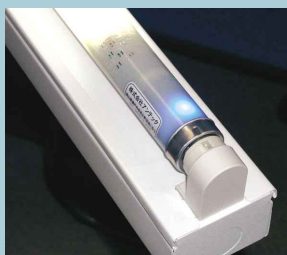
センサー内蔵型 LED 蛍光灯 SKH085